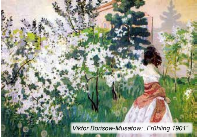
Viktor Borisow-Musatow: „Frühling 1901“

Eine musikalische Hommage an den Dichter Alexej K. Tolstoj. Es gibt mehr als 130 Vertonungen zu den Werken von Tolstoj, hauptsächlich Lieder. Komponisten wie Rimskij-Korsakow, Tschaikowsky, Rachmaninow und Liszt vertonten Gedichte von Tolstoj. Die populärsten von ihnen, die auch heute einen festen Platz im Repertoire der russischen Sänger/innen haben, werden an diesem Abend vorgestellt.